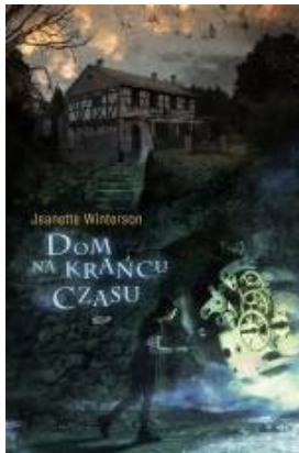
Jeanette Winterson Dom na krańcu czasu